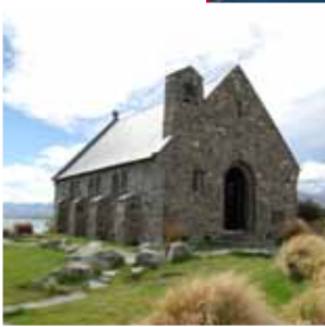
Jack's Point Golf