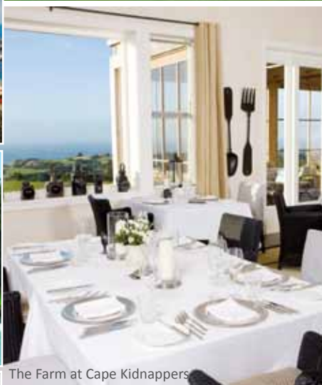
The Farm at Cape Kidnappers