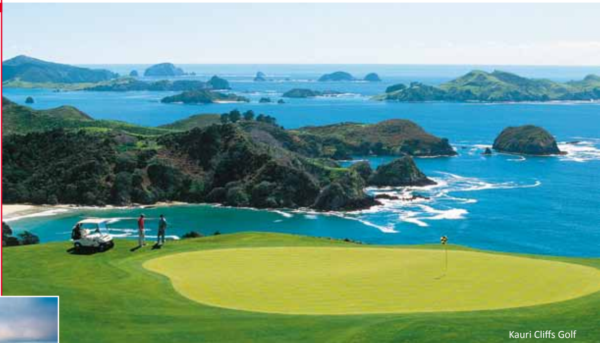
Kauri Cliffs Golf

ab € 4.033,- in der Business Class (C) ab € 5.370,- in der First Class (A) (gültig bei Buchung bis 30.09.2010)